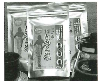
『美容健康 きのこ茶』は、無添加、無着色、無香料。新潟市（新潟IPC財団）の「[にいがたの食]開発支援補助金」を活用して開発しました