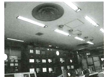
蛍光灯が使用されているところ全て使用できます。写真は、同社のLED照明を導入した新潟のテレビ局