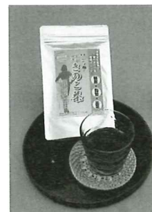
毎日の食後のティータイムに。お茶は温めても冷やしても美味しくいただけます