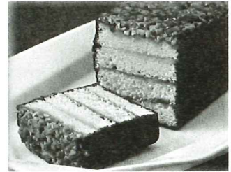
伝統の味を受け継ぐ 念吉の「プラリネ」

(株)念吉 〒950-0075 新潟市中央区沼垂東3-2-2 TEL : 025-244-5630 FAX : 025-246-0875