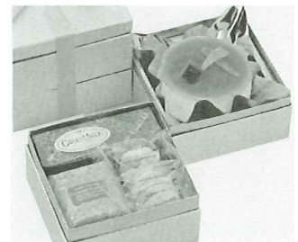
『プラリネ』入りの式菓子 (写真は「ピュア・ラブ」 税込3,150円)