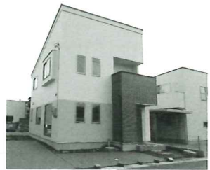
『880シンプルシリーズ』