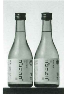
純米吟醸酒『コピリンコ・こびりんこ』 内容量300ml、価格700円(税込)

ラベルに付けた小泉氏の推薦文にもあるように、味は一言で表すと「妙味必淡(みょうみひったん)」「淡い味わいこそ忘れ得ぬ本物の味」。冷でも燗でも美味しくいただけます。