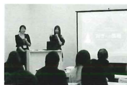
起業家向け無料セミナーの様子。詳細は同社HPに随時掲載されています。