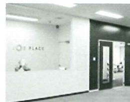
白を基調とした清潔感のある受付。日中はスタッフが常駐し、夜間は専用出入口からご利用いただけます。

(株)ジョブプレイス 〒950-0917 新潟市中央区天神1-1 プラーク3 2F TEL 025-278-3308 (9:00~17:00) FAX 025-278-3174 http://www.jobplace.jp/niigata