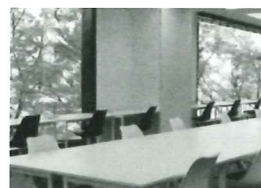
デスクスペースは、窓に面した明るい空間にゆったりと机が並んでいます。このほかに個室、フリースペース、時間単位で利用できる多彩な会議室があります。