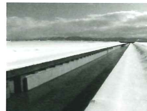
ストパネ工法による新潟市南区茨管根の国営新村排水路