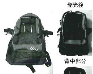
「ELリュック」 価格9,300円(税抜)

単3電池2本を使用(約100時間連続使用可能)。電池を外せば、クリーニング可能です。