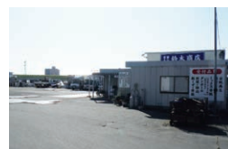
新潟市にある本社

(有)鈴木商店 〒950-0954 新潟市中央区美咲町2-3-7 TEL 025-285-0080 FAX 025-285-0083 http://www.suzukishoten.net/