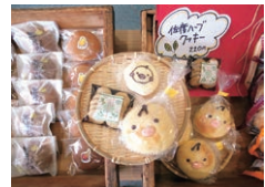
クッキーなどのお菓子もセレクトショップで販売中