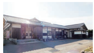
鷺が傷を癒した伝説が残る新穂湯上温泉

新穂湯上温泉 http://niibokatagamionsen.com 〒952-0103 佐渡市新穂湯上1111 TEL 0259-22-4126 (よいふる) 【営業時間】 10:00～21:00 (「さぎの湯」は14:00～21:00) 【休館日】 水曜日 (祝日の場合開館)