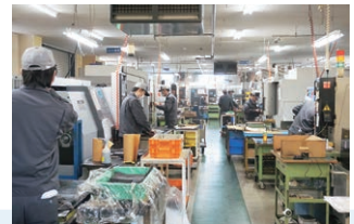
若い技術者が活躍する工場の様子