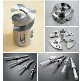
同社の巧みな加工技術による精密機械部品（一例）

(有)エムテック 〒959-2221 阿賀野市保田6110-2 TEL 0250-68-2758 FAX 0250-68-2516 http://www.m-tec.ne.jp/